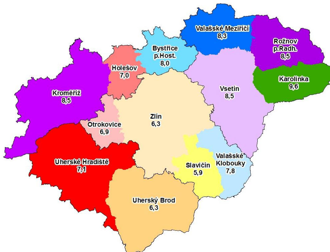
Toky uchazečů o zaměstnání v I.pololetí 2013