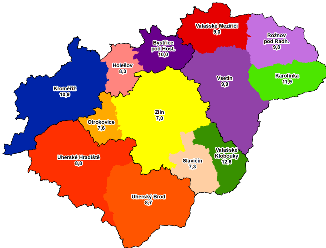
Absolventi škol evidovaní k 30.9.2011 - vzdělání