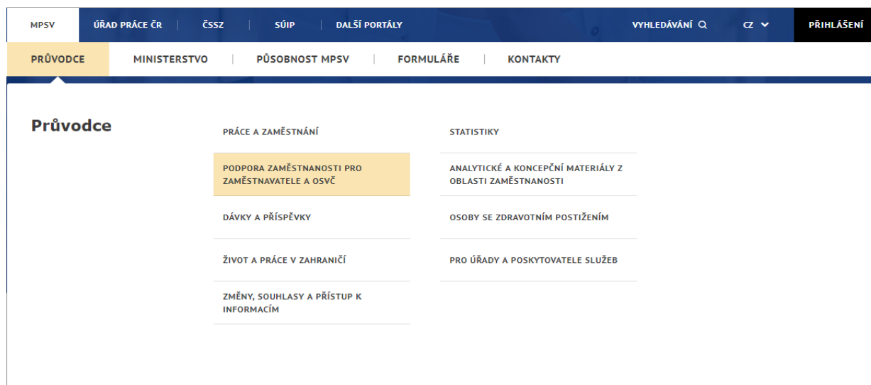
Obrázek 1: Přístup k aplikaci pro vyhledávání zájemců o práci

Na úvodní stránce portálu MPSV vyberte v hlavním menu záložku MPSV . V následujícím menu druhé úrovně vyberte záložku Průvodce a v zobrazeném navigačním menu zvolte položku Podpora zaměstnanosti pro zaměstnavatele a OSVČ .