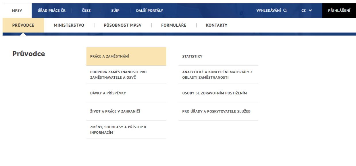
Obrázek 1: Přístup k aplikaci Agentury práce

V hlavním menu portálu zvolte záložku MPSV . V následujícím menu pokračujte přes záložku Práce a zaměstnání .