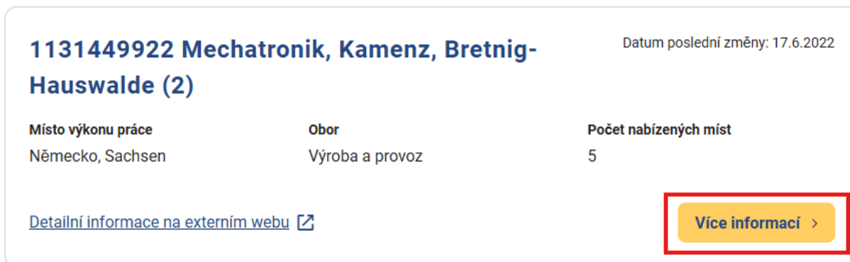
Obrázek 7: Volné místo EURES zobrazené v seznamu výsledků vyhledání s tlačítkem Více informací

U každého z vyhledaných a zobrazených volných míst v seznamu je k dispozici tlačítko Více informací pro zobrazení stránky s detailními informacemi o daném volném místě EURES.