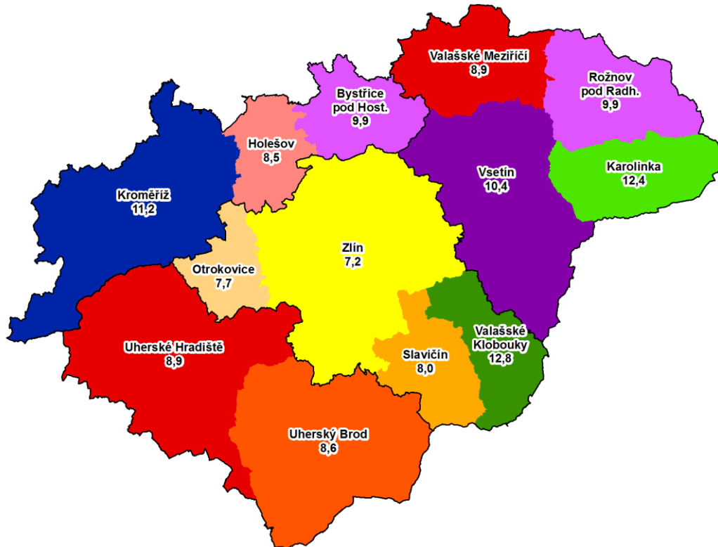
Procentuální podíl uchazečů o zaměstnání s nárokem na podporu v nezaměstnanosti